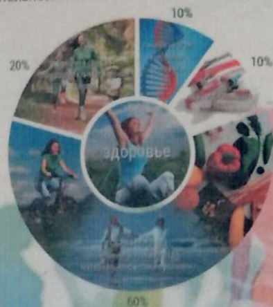
Элементы здорового образа жизни.

Известно, что состояние здоровья человека лишь на 10% зависит от медицины, еще на 10% от наследственности, на 20% от окружающей среды и на 60% – от образа жизни и состояния души. Вот где кроются большие резервы улучшения качества и продолжительности жизни человека!